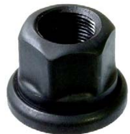
Porca Açopress Alta