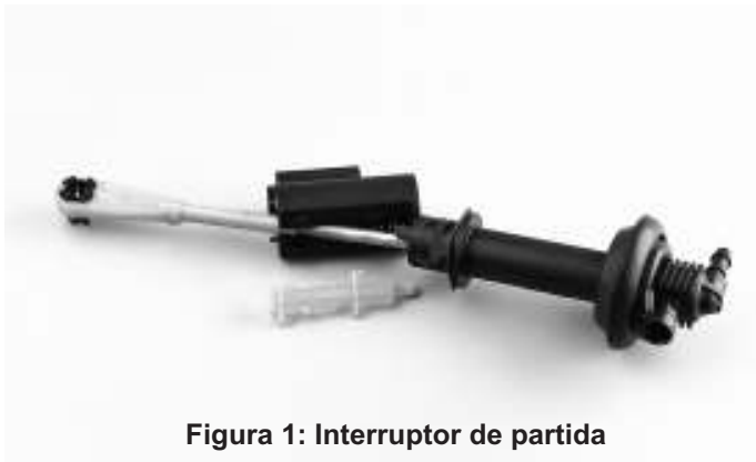
Figura 1: Interruptor de partida

Remova o interruptor de partida da haste do cilindro mestre localizado no pedal da embreagem (fig.1).